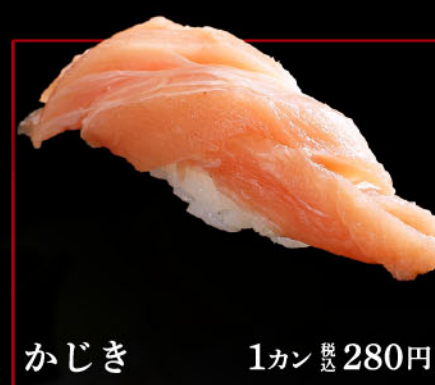
かじき 1カン 税込 280円