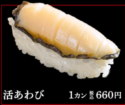
活あわび 1カン 税込 660円