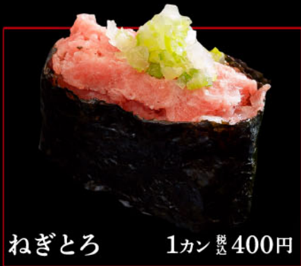
ねぎとろ 1カン 税込 400円