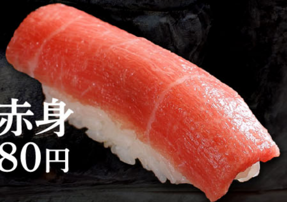
赤身 1カン 税込 280円