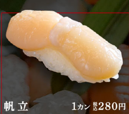
帆立 1カン 税込 280円