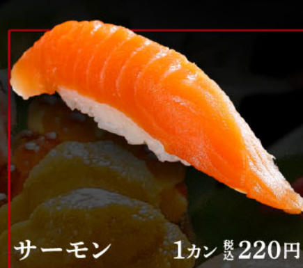
サーモン 1カン 税込 220円