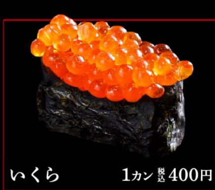
いくら 1カン 税込 400円