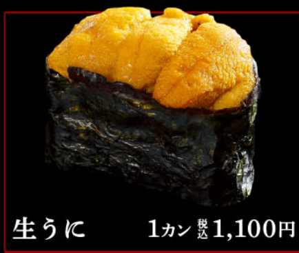
生うに 1カン 税込 1,100円