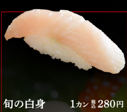
旬の白身 1カン 税込 280円