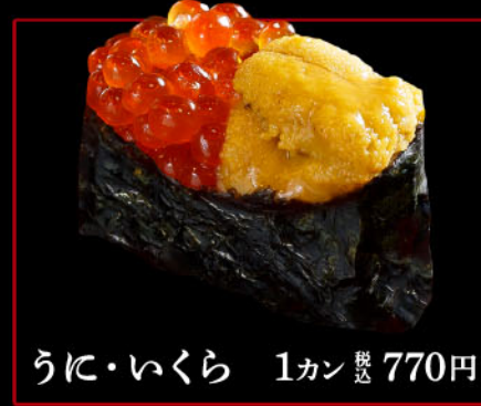
うに・いくら 1カン 税込 770円