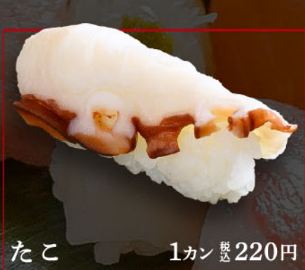
たこ 1カン 税込 220円