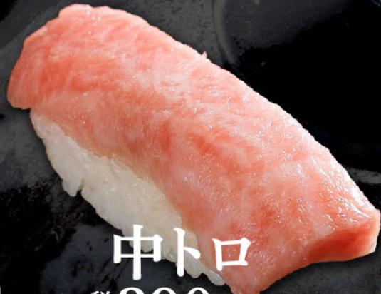
中トロ 1カン 税込 390円