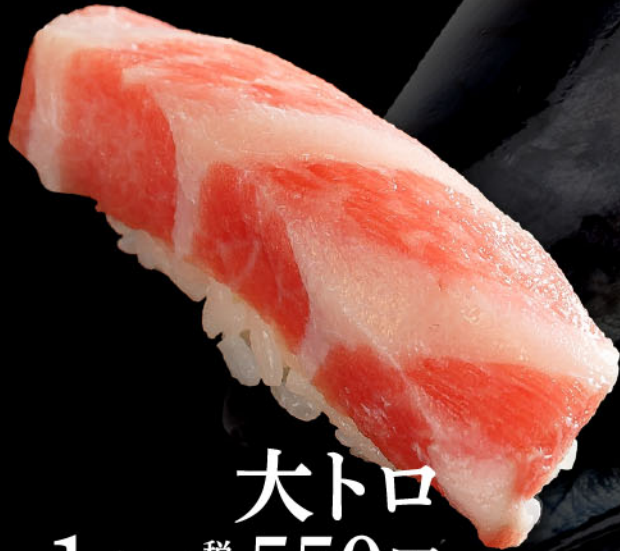
大トロ 1カン 税込 550円