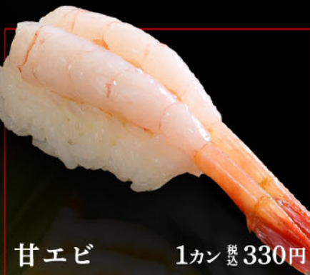
甘エビ 1カン 税込 330円