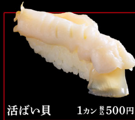
活ばい貝 1カン 税込 500円