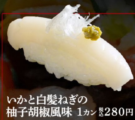
いかと白髪ねぎの 柚子胡椒風味 1カン 税込 280円