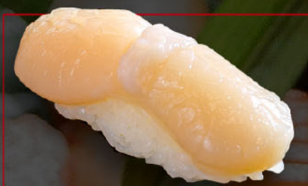
帆立 1カン 税込 280円