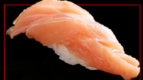
かじき 1カン 税込 280円