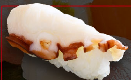
たこ 1カン 税込 220円