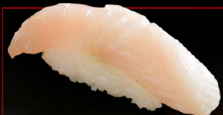
旬の白身 1カン 税込 280円