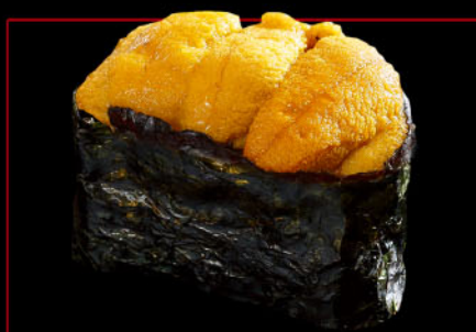
生うに 1カン 税込 1,100円