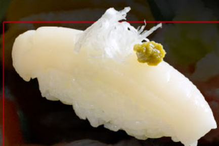
いかと白髪ねぎの 柚子胡椒風味 1カン 税込 280円