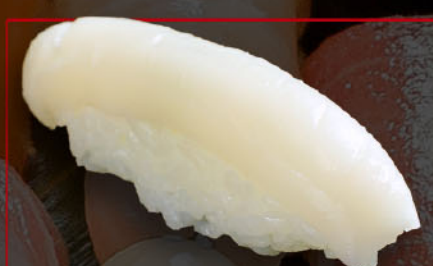
いか 1カン 税込 220円