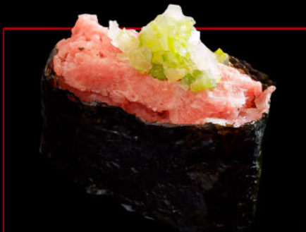
ねぎとろ 1カン 税込 400円