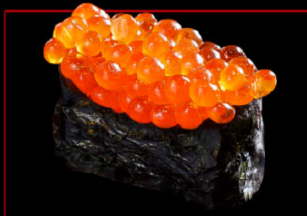
いくら 1カン 税込 400円