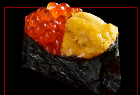
うに・いくら 1カン 税込 770円