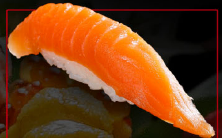
サーモン 1カン 税込 220円