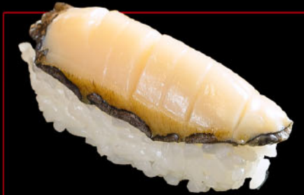
活あわび 1カン 税込 660円